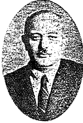
Hafız Sadeddin Kaynak

Sadeddin Kaynak. bugün müzik eserleriyle en yüksek başarıları kavuşmuş. Âtilere doğru kök salmış parlak bir artistimizdir [1].