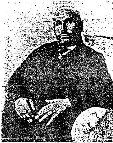
Hafız Sami 1928

Hafız Sâmî'nin sesinin zati, o derece tatlı ve o kadar çekici idi ki kemanın perdesindeki lezzetin çok üstünde bir tatlılık taşırdı. Yakından tanıyanlar pek iyi bilirler ki Sami'nin sesinden sonra keman sesi yavan kalırdı. Bu hayret verici iş, pek iptidai tarzda alınmış ve bugün elde bulunan plâklarından da bir dereceye kadar anlaşılabilir.