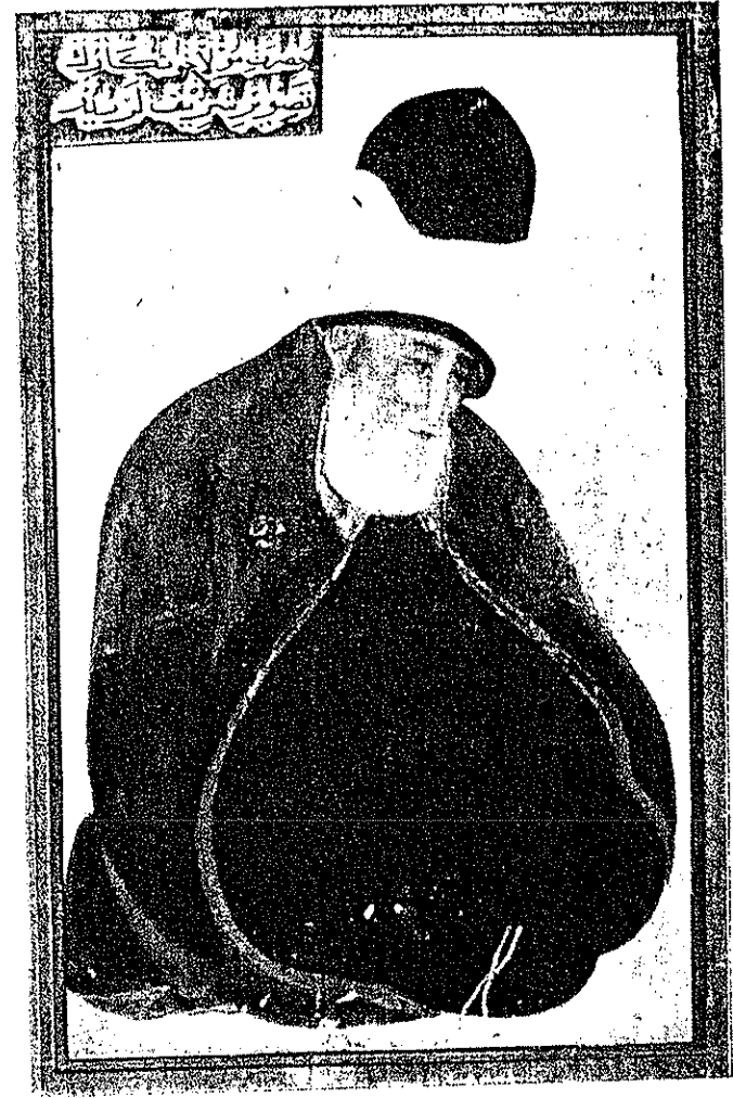
MEVLANA CELALEDİN HAZRETLERİ (Minyatür, Belediye Müzesi).