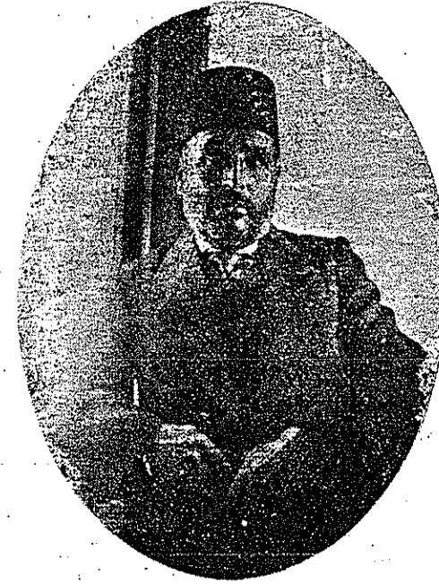
Hafız Sâmi 1920

düştünüz. O ise soluğurtun daha başındadır. «Merhabenbik» sözüne tiz nevedan girmiştir. «Ya Muhammet» nidasını tiz «fâ» üzerinde bir kavis yaparak icra etmiş, «Muhammet» münâdâsı üzerinde «san'atı nida»yı ifa eylemiş «dediler» gürtesindeki perde yine tiz nevadır. Siz yoruldunuz. Çatlayacaksınız. Okuyucu soluk almadan nasıl okuyor diye hayretiniz