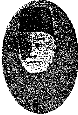
Büyük üstad, meşhur Şaşı Hafız Osman

Bunlardan başka daha birçok okuyucularımız vardır. Onları da burada anmak isterdik. Ancak eserimizin başında yazdığımız veçh üzere daha çok yazmak için vaktimiz kalmamıştır. Hafız Sâmîye aid daha yazacaklarımız vardı.